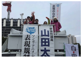
1月 コミックマーケットでコスプレ。そして駅前前で演説してきました。すごい人で道路にまで人があふれてました。