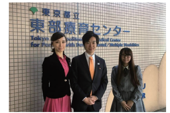
東部療育センター、東砂福祉プラザ、ヘレン東雲に視察にいきました。医療的ケア児についての質問をしました。