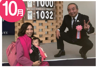
10月 区民まつりにて東京オリンピックまで1000日前イベント。お世話になっている議長とりました。