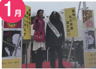
1月 成人式にて。薬物乱用防止のコーナーにて。3768名の新成人の方に案内をされたとのことでした。