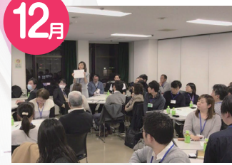
12月 多世代交流について医療介護関係者などのように多世代交流をして私たちは未来に何を残せるのかを考えました。