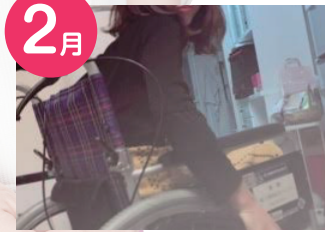
2月 自分で車いすにのってどんな生活になるのか体験で借りました。車いすが過ごしやすい江東区にしたいです。