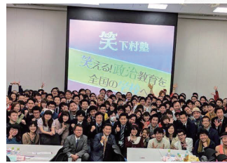
たかまつなさんの、笑える！政治教育in国会で、投票率が8.4%にしたということでわかりやすかったです。