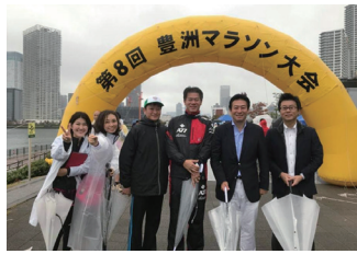
11月 豊洲マラソンにて今年も例年通り司会進行を務めました。土砂降りでした。義足体験もしました。